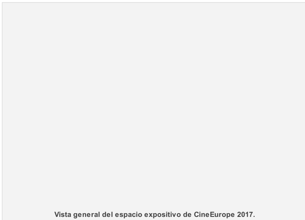
Vista general del espacio expositivo de CineEurope 2017.

El segundo día del mayor evento europeo de la exhibición destacó por la apertura al público del espacio expositivo para visitar los stands de las 122 compañías que presentan sus novedades; la Asamblea General de UNIC, donde Laura Houlgatte tomó posesión como nueva CEO y el Consejo Directivo decidió adherirse a la Global Cinema Federation; cinco Focus Sessions sobre varios temas candentes en el sector, y las presentaciones de producto de dos grandes estudios: Universal y Fox.