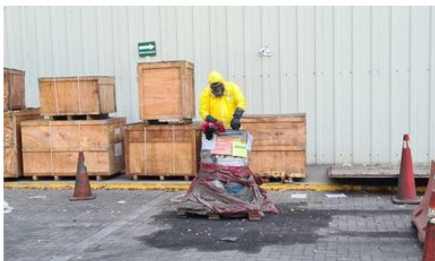
Inactivación de Benzaldehído