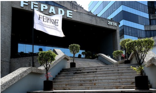
La FEPADE y SEDATU firman carta compromiso por el blindaje electoral

Autor Procuraduría General de la República