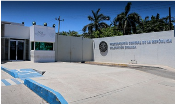
Inicia PGR investigación por delitos federales

Autor Procuraduría General de la República