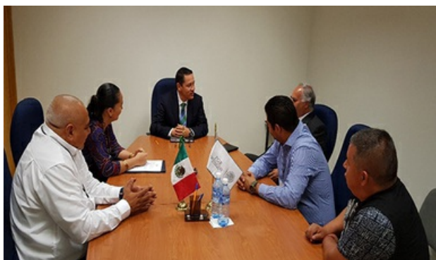
PGR en Morelos lleva a cabo reunión de trabajo con SEGOB y CFE

Autor Procuraduría General de la República