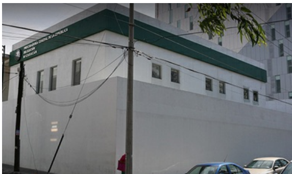
Asegura PGR dos personas en posesión de armas de fuego en Zamora

Autor Procuraduría General de la República