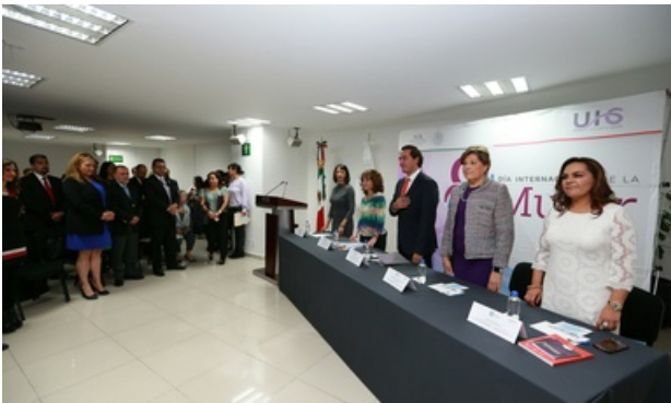
Impulsa PGR incorporación de las mujeres a la fuerza laboral

Autor Procuraduría General de la República