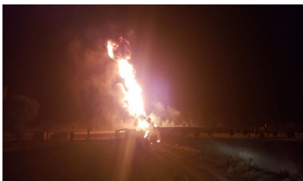
Localizan cinco tomas clandestinas en Jalisco