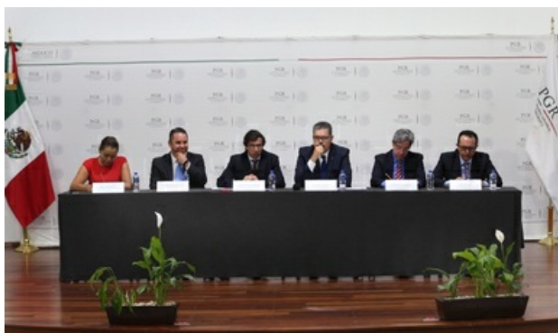
Capacitación, herramienta fundamental en el crecimiento institucional de la PGR

Autor Procuraduría General de la República