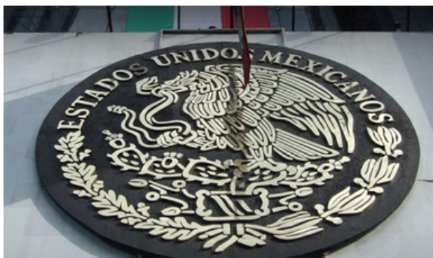
Entrega EUA al Gobierno de México a fugitivo requerido por homicidio culposo