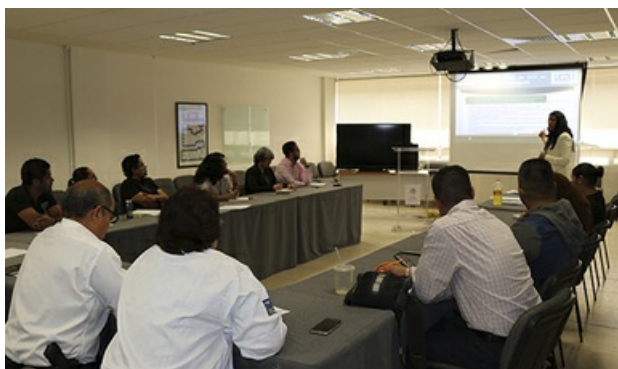
PGR capacita a su personal entorno al Sistema Nacional Anticorrupción

Autor Procuraduría General de la República