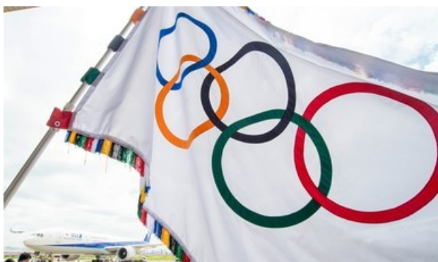
Aros olímpicos. Especial

• La decisión se tomó tras analizar la situación actual que se vive en aquel país, consecuencia de la pandemia por el virus SARS-CoV-2; el certamen continental estaba programado para realizarse del 10 al 16 de mayo, y repartiría 49 plazas olímpicas, 33 para hombres y 16 para mujeres