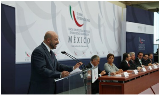
Se inauguró el Foro "Hacia una Política de Estado en Seguridad Nacional en México".

Por primera vez se brindó un enfoque multidimensional para las labores en esa materia, afirmó.