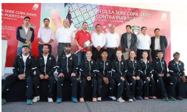
Alfredo Castillo Cervantes, titular de la CONADE, encabezó la presentación de la Serie de la Copa Davis México-Puerto Rico

**Presentó en el CNAR la Serie de la Copa Davis México-Puerto Rico que se llevará a cabo en Tijuana, Baja California, el 3 y 4 de febrero de 2018 // Boletín 3357