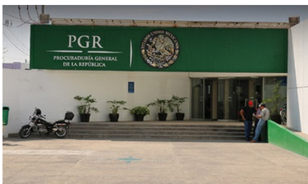
PGR sede de reunión plenaria de la mesa de seguridad y justicia con funcionarios de los tres niveles de gobierno