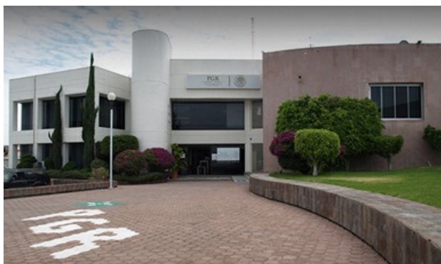
PGR asegura máquinas tragamonedas en el municipio de Huimilpan