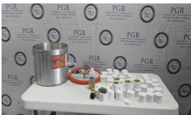
Asegura AIC estupefacientes en empresa de paquetería en Guadalajara