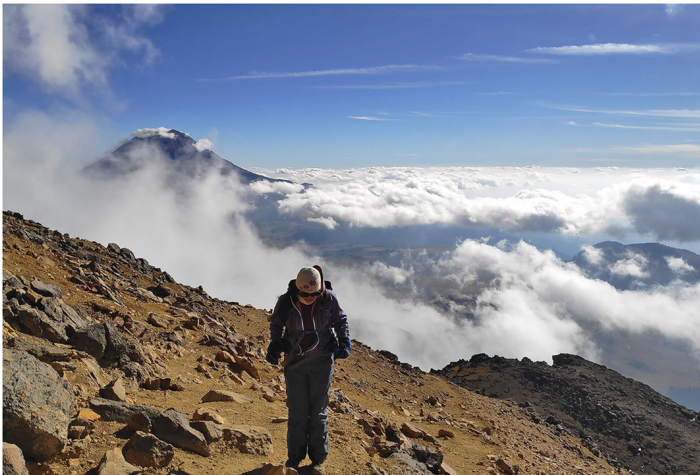
Volcán Popocatépetl desde el Iztaccíhuatl.

Respetar el área de exclusión de 12 km. No subestimes el riesgo potencial de estar en un volcán activo