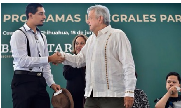
Presidente Andrés Manuel López Obrador

Empezamos a entregar apoyos a los de abajo; por el bien de todos, primero los pobres