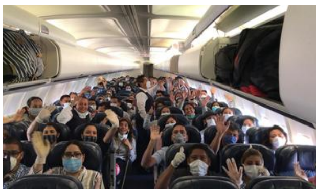
Repatriación exitosa de personas mexicanas desde Honduras y El Salvador

Comunicado Conjunto RELACIONES EXTERIORES-SEGOB-INM