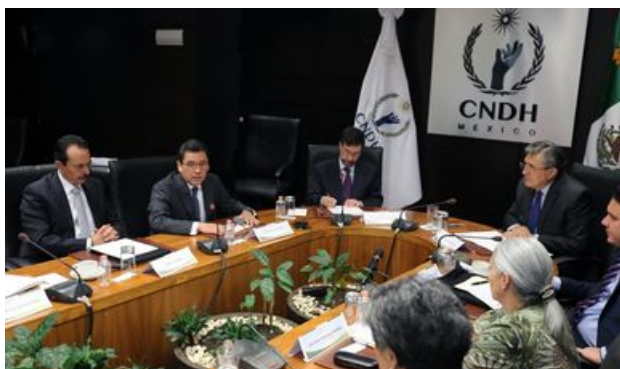
Firman acta de integración de gestión por competencias en el Sistema Penal y Derechos Humanos