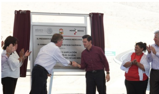
El Primer Mandatario entregó el tramo Tecate –San Antonio de las Minas de la carretera Tecate-El Sauzal.

"Deseo que de aquí al 1 de julio el entorno de campañas políticas privilegie más la propuesta constructiva y positiva del futuro desarrollo que tenga el país, que la polémica que, invariablemente, siempre se suscita en toda campaña político-electoral".